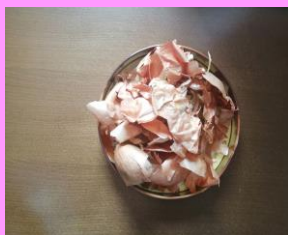
Kora crvenog luka