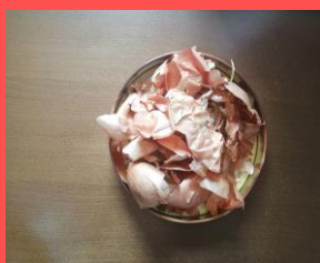
Kora crvenog luka